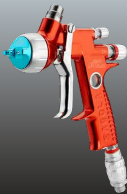
4600 Xtreme EAU