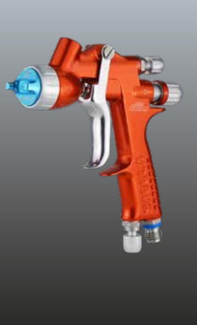
mini Xtreme RÉPARATION RAPIDE