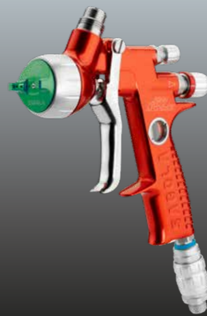
4600 Xtreme HVLP