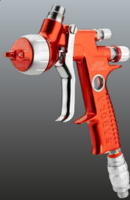
4600 Xtreme HS