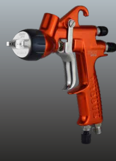
3300 GTO PRIMER