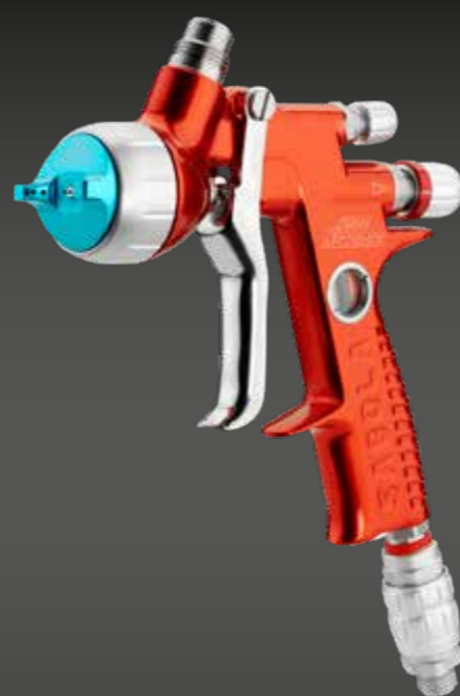
4600 XUREME EAU