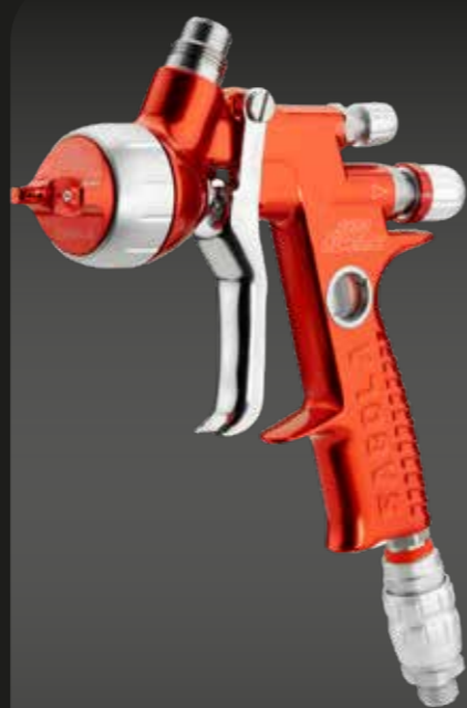
4600 XUREME HS