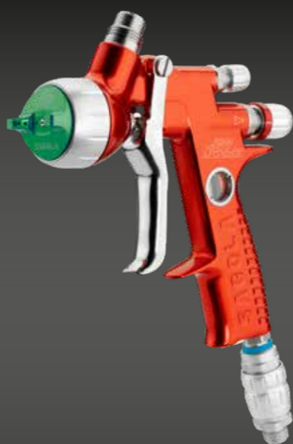
4600 XUREME HVLP