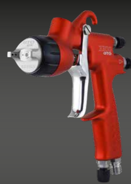
3300 GTO PRIMER