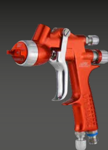
mini XUREME REPARATION RAPIDE